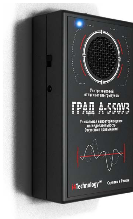
Рисунок 1 – внешний вид прибора

1.2.1 Внешний вид изделия представлен на рисунке 1